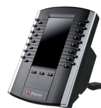
Module d'extension VVX