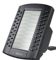
Module d'extension VVX