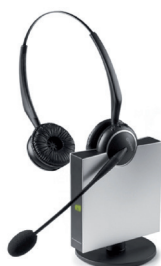
Casque sans fil EHS